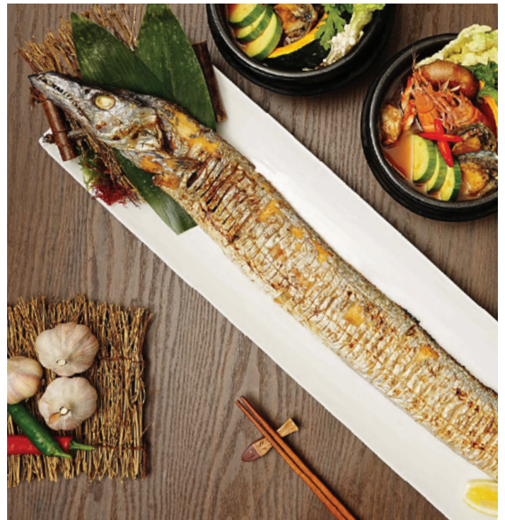
제주 통갈치 구이와 해물 떡배기