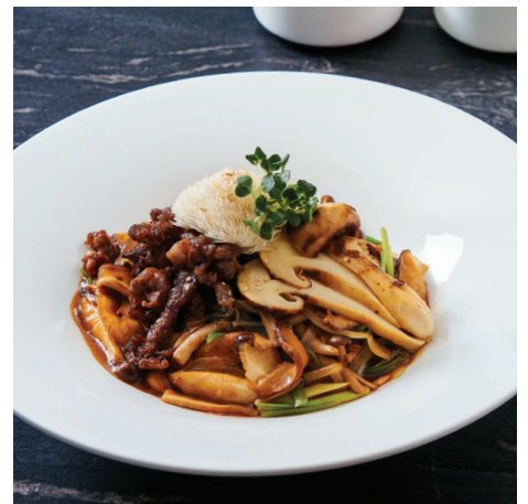
한우 버섯 덮밥