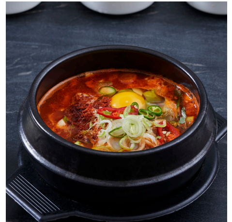
제철 굴 순두부