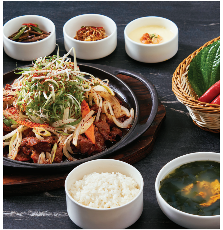
파채 제육 볶음과 성게 미역국