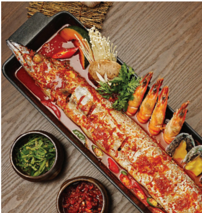
제주 통갈치 조림과 미역국