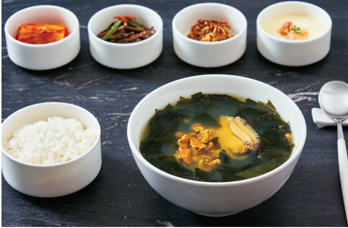
전복 성게 미역국