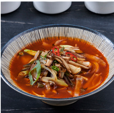
시에나 굴 짬뽕