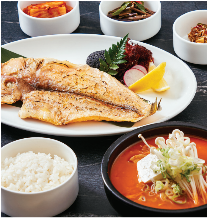
제주 옥돔과 흑돼지 김치찌개